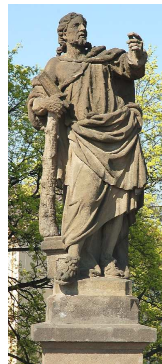
socha sv. Judy na Saském mostě v Plzni

Apoštolové měli to štěstí, že mohli s Ježíšem mluvit tvář v tvář a být přímými účastníky jeho zázraků. Několik světců zapsalo své svědectví o tom, že se jim Ježíš zjevoval. Většina z nás pravděpodobně podobnou zkušenost nemá a spíš bojujeme s Ježíšovou skrytostí a nepřítomností. Nemůže však za tím vším zaznívat jeho velmi tichá a velmi zdvořilá touha po našem svobodném a dobrovolném rozhodnutí pro něj, kterou si nechce vynutit ani tím, že by nás nakopl svou evidentní přítomností?