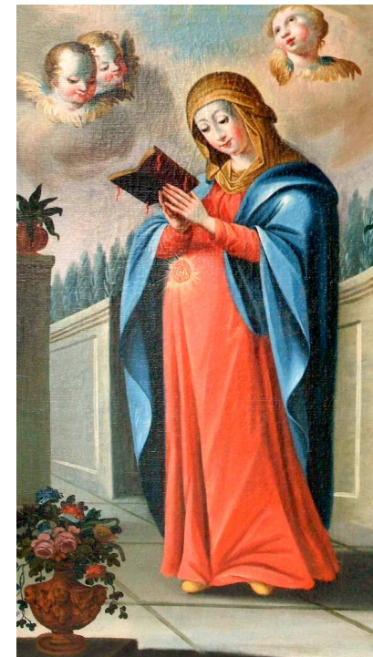
Maria gravida – zobrazení těhotné Panny Marie.