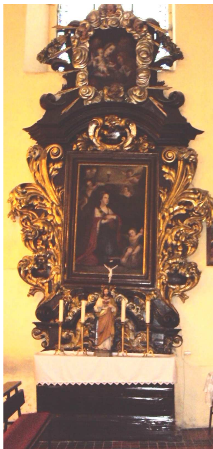
oltář sv. Barbory v dýšinském kostele

připravil Jan Blažek - Srov. http://www.abcsvatych.com/mesice/a12/prosinec4.htm